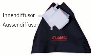
Softbox / Octabox