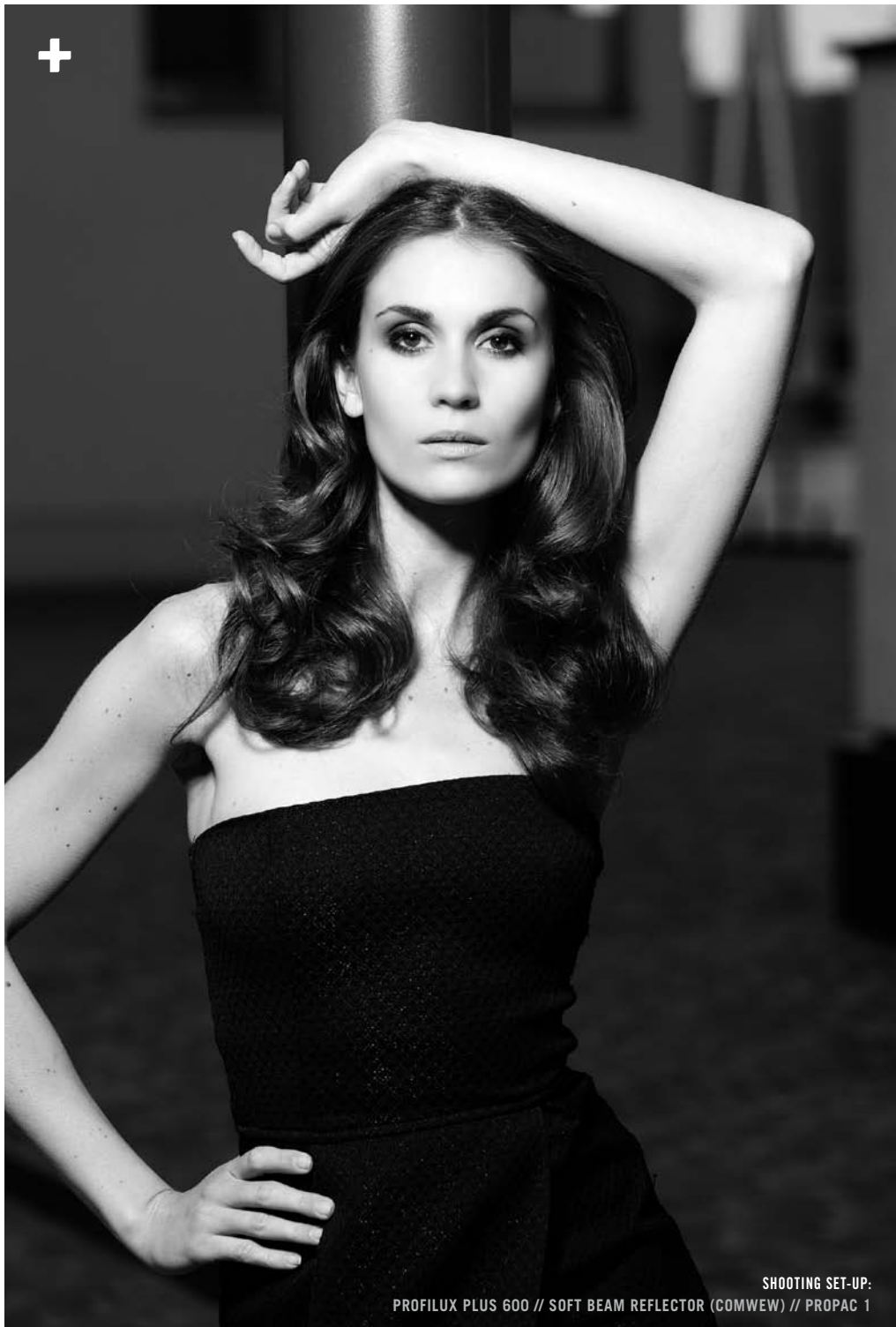
SHOOTING SET-UP: PROFILUX PLUS 600 // SOFT BEAM REFLECTOR (COMWEW) // PROPAC 1